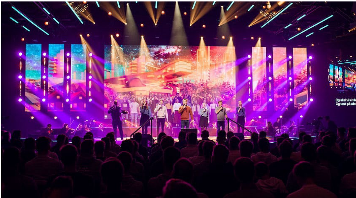
Oppbyggelig samling under BUKs Høstcamp i 2021, der XZ gjennomførte flere aktiviteter.

Foreningen har også søkt og mottatt støtte fra staten ifm. avlyst arrangement gjennom krisepakken for frivilligheten. Støtten har vært viktig for at vi kan tilby et like godt arrangement når situasjonen og smittevernsreglene tillater det. Vi er glade for at det offentlige har gitt viktig økonomisk støtte til frivilligheten og XZ.