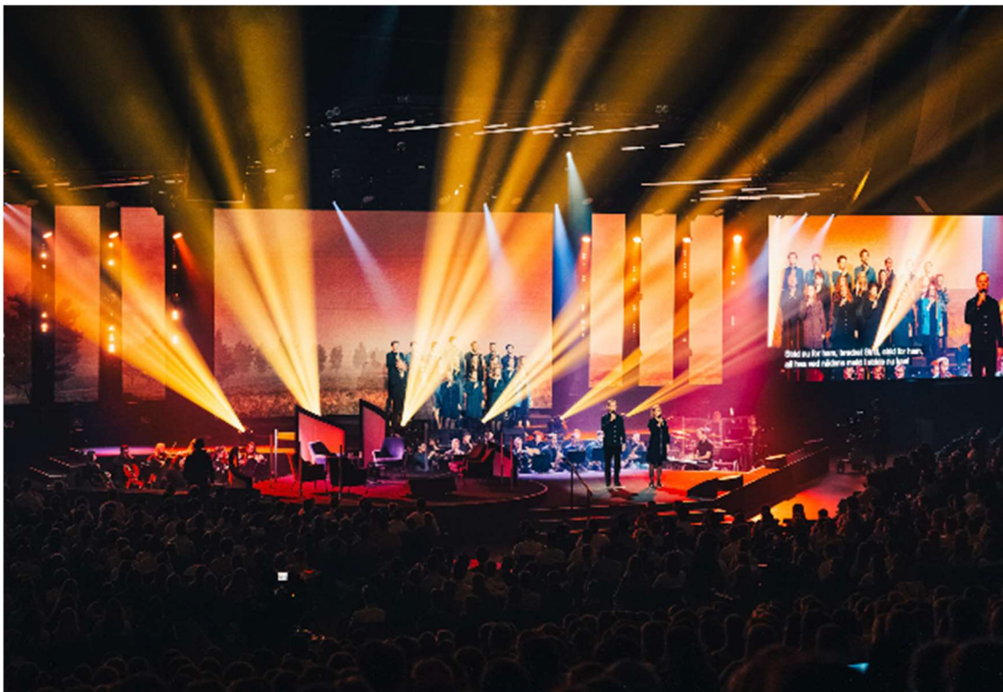
Oppbyggelig samling under BUKs sommercamp i 2022, der XZ gjennomførte flere aktiviteter.

I 2022 har aktivitetsnivået tatt seg opp igjen etter mye nedstengning under pandemien. XZ har arrangert ligaspill, samlinger og turneringer gjennom året for flere tusen deltakere. I tillegg har XZ bidratt med innholdsleveranser til 4 Brunstad Ungdomsklubb (BUK) Camper i løpet av året, hvor flere tusen ungdom har deltatt. Vi har hatt fokus på å opprettholde og utvide rekrutteringsarbeidet, slik at barn i målgruppen 6-12 år finner glede og mestingsfølelse ved å delta i idrettsaktiviteter i trygge og trivelige rammer med gode forbilder som trenere. Blant annet har det under Brunstad Christian Church sine arrangementer på Oslofjord Convention Center blitt avholdt skoler innenfor grenene håndball, volleyball, fotball, klatring og ishockey for barn.