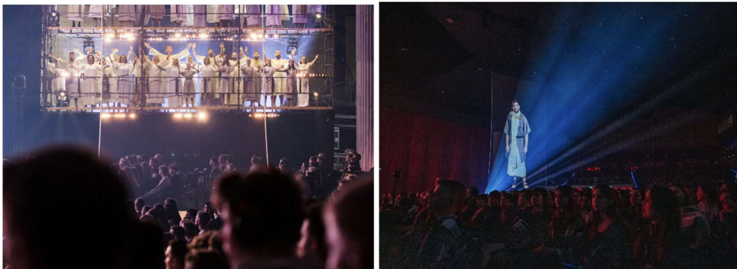
Temakveld under BUKs Påskecamp i 2022, der XZ gjennomførte flere aktiviteter.

Det var høye forventninger til påskecampen 2022 da spesielt fordi det nå var tre år siden sist påskecamp på grunn av pandemien. I tillegg så veldig mange frem til særlig temakvelden om påsken i år 33. Her skulle deltakerne virkelig få illustrert hva som skjedde i det som skulle bli den første kristne påsken, hvor Jesu død på korset snudde opp ned på jødernes påsketradisjon og han ble vår frelser.