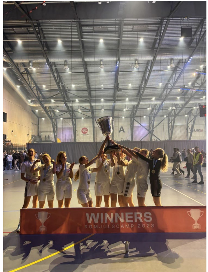
Fra Futsalturnering under BUKs romjuls-camp.

Futsal har vært i fokus med to turneringer under BUKs camper, samt futsalturneringer i forbindelse med både søstrestevnet og brødretevenet. I tillegg har det blitt arrangert turneringer for barn og ungdom i alderen 6–20 år under både påskestevnet, pinsestevnet og sommerstevnet. Her ble barn gitt mulighet til å utfolde sine fotballinteresser i trygge og gode omgivelser.